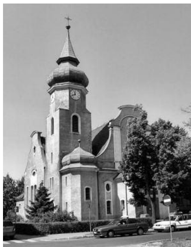
Kościół Jezusowy, pl. Bohaterów