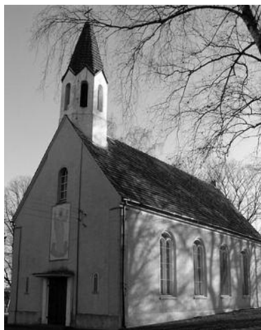
Kościół Aniołów Bożych ul. św. Brata Alberta 3