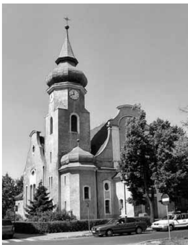
Kościół Jezusowy, pl. Bohaterów